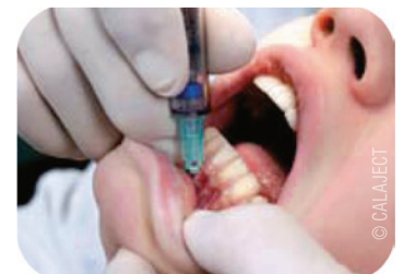
Abb. 4: Infiltrationsanästhesie.