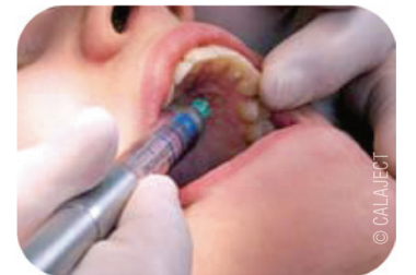
Abb. 2: Palatinale Injektion.