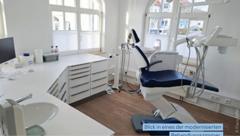
Blick in eines der modernisierten Behandlungszimmer.