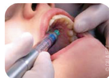
Abb. 2: Palatinale Injektion.