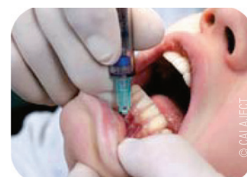
Abb. 4: Infiltrationsanästhesie.