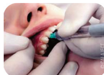
Abb. 1: Intraligamentäre Injektion.