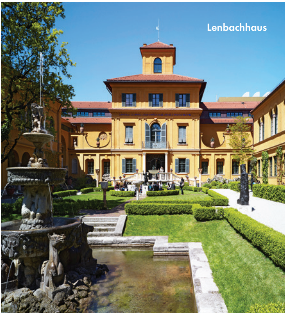
© Städtische Galerie im Lenbachhaus und Kunsthaus München