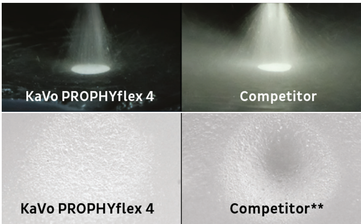
**Abtrag KaVo PROPHYpearls im Vergleich mit Pulverstrahlgerät eines Wettbewerbers mit Calciumcarbonat, dargestellt auf SonicFill™ Komposit.

sich weniger stark im Raum, was die Reinigung nach der Behandlung erleichtert und die Oberflächen schont.