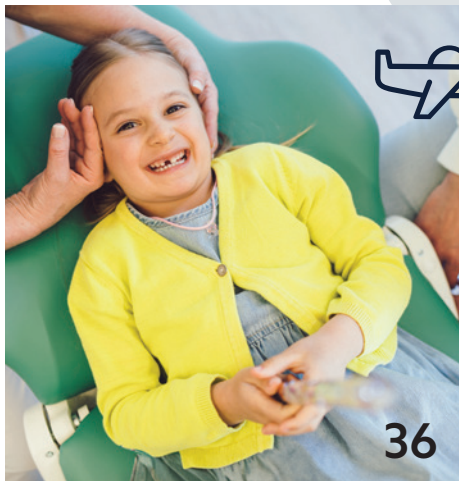
Illustration: © Michael Werner | Foto: © Korbinian Assbichler

Ganz viel Erfahrung, Know-how und Vernetzung für eine starke Kinderzahnmedizin