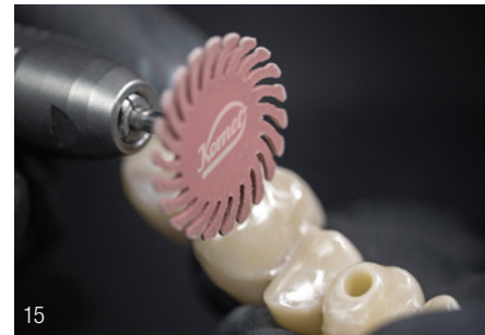
Abb. 11: Effiziente Ausarbeitung der Kaufläche mit der Turbine (Wasserkühlung) mit ZR-Schleifer (Komet Dental). – Abb. 12+13: Politur mit zweistufigem Poliersystem für Vollkeramiken (ETNA, Komet Dental) – erst rot (Vorpholitur), dann grau (Hochglanzpolitur). – Abb. 14+15: Spiralpolierer zur Vor- und Hochglanzpolitur: Die flexible Form passt sich flexibel der Oberflächenkontur an.

Lichtreflexion sowie -brechung und damit die Lebendigkeit der Restauration.