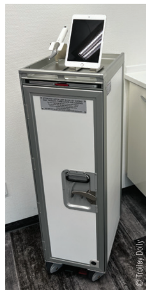
Trolley Dollys erfreuen sich zunehmender Beliebtheit in Praxen, hier im Praxiseinsatz in Weihenzell.