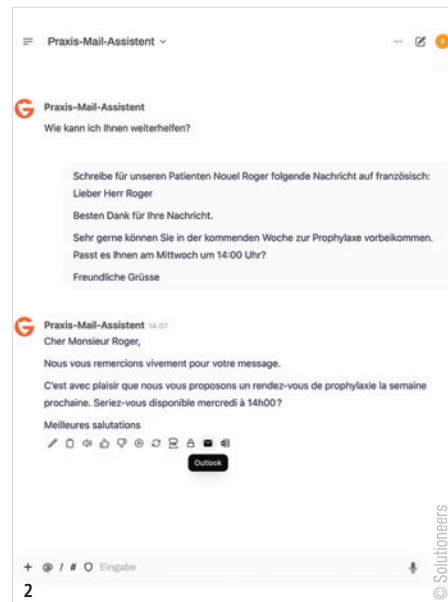
Abb. 1: Gespräch live transkribiert, Aufklärung automatisch erstellt mit AnyGuard-Dental. – Abb. 2: Terminbestätigung auf Französisch? Kein Problem – AnyGuard-Dental erstellt patientengerechte Texte auf Knopfdruck.

Solutioneers AG hello@s-ag.ch www.solutioneers.ag