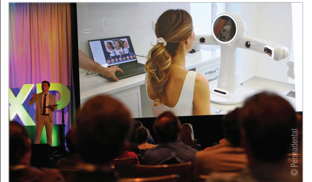
VENEER MASTERCLASS IN DÜSSELDORF Smile Makeovers and Full-Mouth Reconstructions