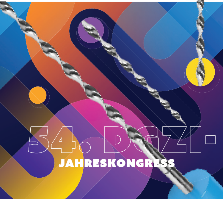
Illustration: © Roisa, Endo-Feile: © Aleksandra Gigowska – stock.adobe.com

[ Themenschwerpunkt: Zahnerhaltung | Endodontie ]