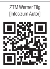
ZTM Werner Tilg [Infos zum Autor]