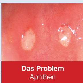
Das Problem Aphthen

Die Naturharzlösung LEGASED natur unterstützt die Wundheilung sowie Geweberegeneration in positiver Weise und trägt zur Schmerzlinderung bei. Die filmbildende Flüssigkeit reduziert das Eindringen von Bakterien und Speiseresten nachhaltig. Das Ergebnis: Bye-bye, Aphthen, Aphten oder „Aften“ – egal, wie auch immer man die unangenehme Mundschleimhautentzündung schreibt.