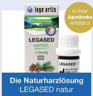
Die Naturharzlösung LEGASED natur