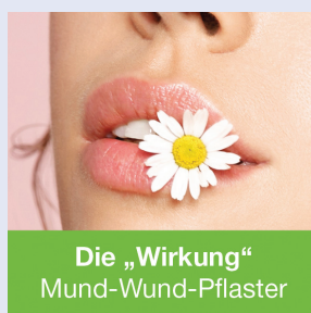
Die „Wirkung“ Mund-Wund-Pflaster

lege artis Pharma GmbH + Co. KG www.legeartis.de