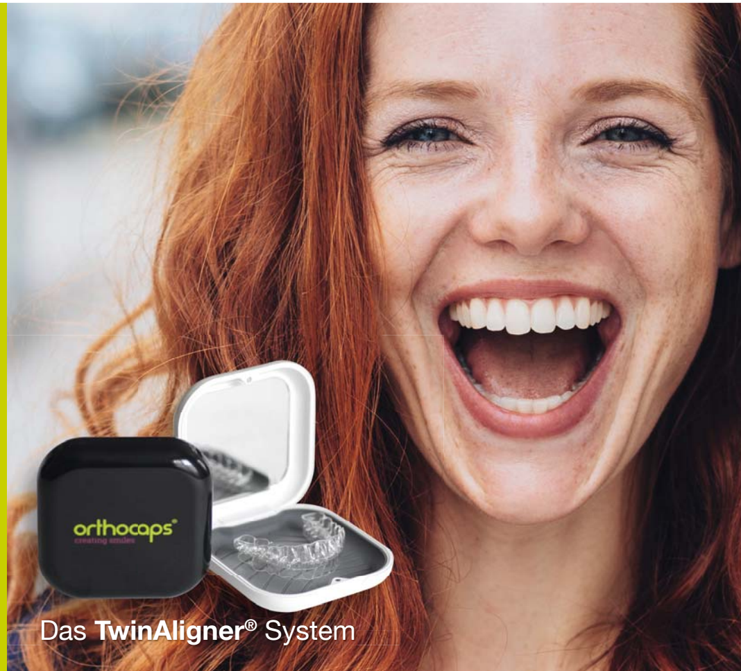
Das TwinAligner® System

Wir laden Sie herzlich ein, uns auf der diesjährigen DGKFO in Leipzig an unserem Stand 05 zu besuchen.