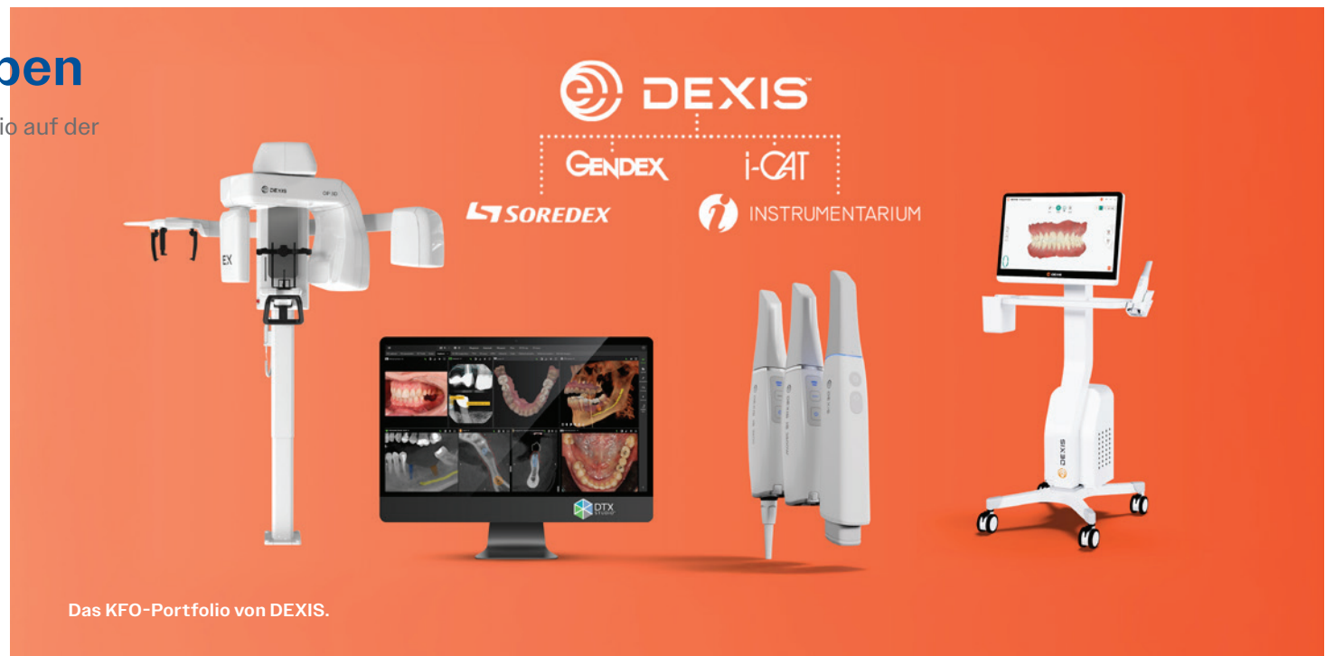
Das KFO-Portfolio von DEXIS.