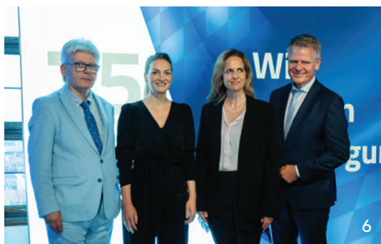
Mit einem Staatsakt ehrte die Bayerische Staatsregierung die KZVB und ihre Mitglieder für 75 Jahre zahnmedizinische Versorgung.