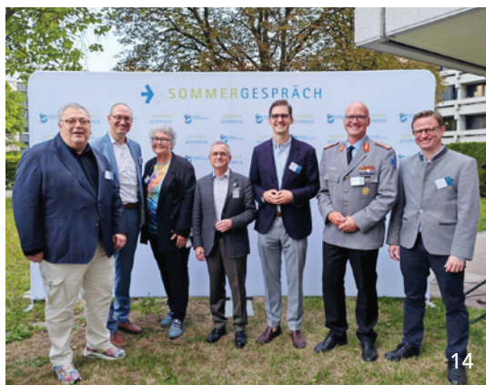
Im Sommer boten sich der BLZK-Spitze zahlreiche Gelegenheiten, Politikern die Standpunkte der bayerischen Zahnärzte zur Sicherung der zahnmedizinischen Versorgung zu vermitteln, wie hier beim Sommergespräch der Bayerischen Landesärztekammer.