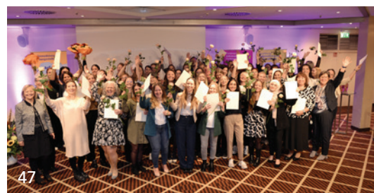
„Lebenslange Prophylaxe – So funktioniert’s“ ist das Motto des diesjährigen Kongresses Zahnärztliches Personal beim 66. Bayerischen Zahnärztetag.