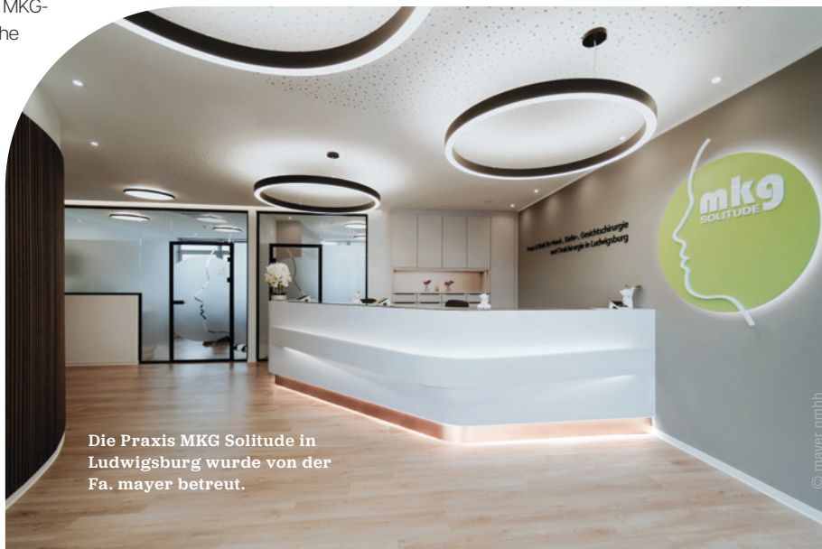
Die Praxis MKG Solitude in Ludwigsburg wurde von der Fa. mayer betreut.

mayer gmbh innenarchitektur + möbelmanufaktur Tel.: +49 7269 91999-0 www.mayer-im.de