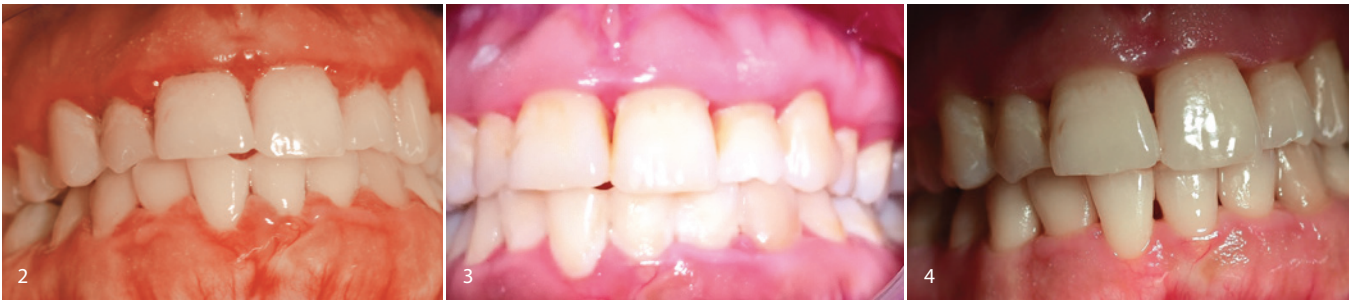
Abb. 2: Ausgangssituation November 2019. – Abb. 3: Situation vor der 2. Initialtherapie Februar 2020. – Abb. 4: Situ zur Reevaluation Juli 2020.

den Initialtherapien die lokale Schmerzausschaltung mit Oraquix Parodontal-Gel (Dentsply Sirona) erfolgte. Nach der 2. Initialtherapie verbesserte sich der BOP auf 58 Prozent, wobei die Mundhygiene mit einem API von 86 Prozent immer noch insuffizient war. Nach umfangreichen Mundhygieneinstruktionen empfehlen wir die Verwendung einer Schallzahnbürste sowie das Pflegen der Interdentalräume (miradent L-Prox, Hager