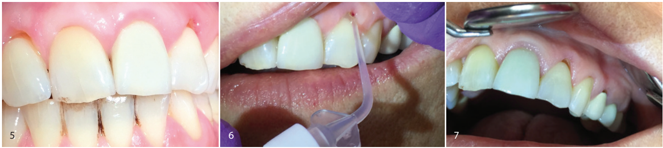
Abb. 5: Gereizte Gingiva aufgrund von Rezessionen, keilförmigen Defekten und Kronenrändern. – Abb. 6: Applikation OXYSAFE. – Abb. 7: Reizlose Gingiva nach Therapie.

nüle geliefert. Die Konsistenz ist optimal, um im Behandlungsgebiet zu verbleiben, damit der Aktivsauerstoff durch den Kontakt mit der Mundschleimhaut aktiviert wird und die schädlichen anaeroben Bakterien somit auch tief in der Tasche eliminiert werden können. Nach fünf Minuten spülte ich die Taschen mit NaCl, das ich mir in einer Spritze mit stumpfer Kanüle aufgezogen hatte, aus. Dann wurde das OXYSAFE Gel wieder in alle Taschen appliziert, wo es verblieb. Für die häusliche Hygiene wurde die Patientin angewiesen, zwei Wochen lang morgens und abends mit der OXYSAFE Mundspüllösung zu spülen.