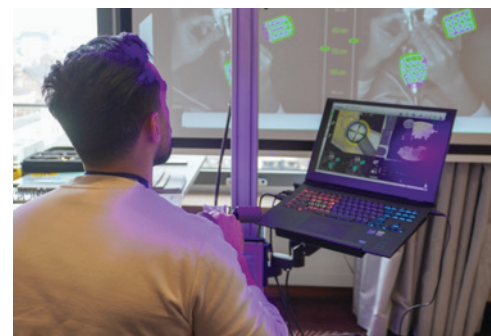
Workshops am Samstag – rotierende Teilnahme.