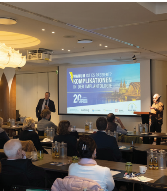
Spannende Vorträge der Experten während des ein- tägigen Symposiums können erwartet werden.

Industriepartner teilnehmen, die, mit den notwendigen Pausen dazwischen, rotierend stattfinden. Auch das Workshop-Prinzip hat sich im vergangenen Jahr bereits bewährt: Hands-on-Kurse intensiv!