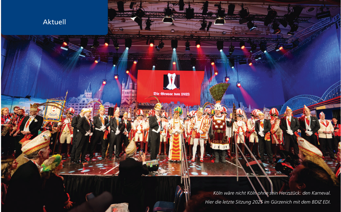
Köln wäre nicht Köln ohne sein Herzstück: den Karneval. Hier die letzte Sitzung 2025 im Gürzenich mit dem BDIZ EDI.

21. Experten Symposium am 14. und 15. Februar 2026 in Köln