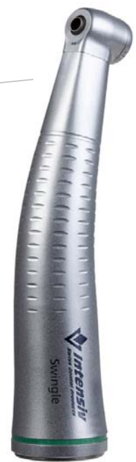
Intensiv Swingle® Pat. EP 2754406B1