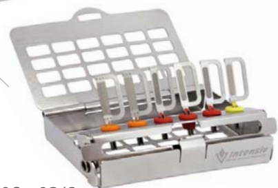
Intensiv OST400Set03/6 Intensiv Ortho-Strips® System Pat. EP 15201863.6