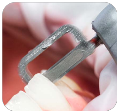
Zahnschmelz reduzieren mit Intensiv Ortho-Strips System, Central, Medium 40 µm