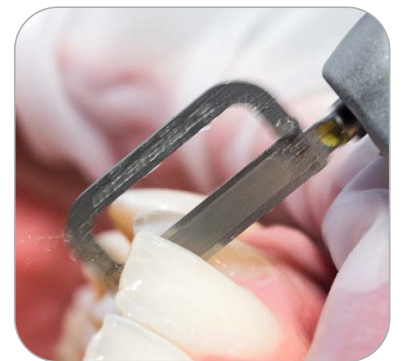
Polieren des Zahnschmelzes mit Intensiv Ortho-Strips System, Central, Polishing, 15 µm

Klinische Abbildungen Dr. Francesco Garino, Turin, Italien