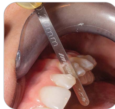
Unterstützung der Kontrolle der Zahnzwischenräume mit Intensiv IPR-DistanceControl