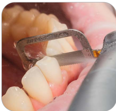
Öffnen des engen Interdentalraumes mit Intensiv Ortho-Strips System, Opener 08 µm