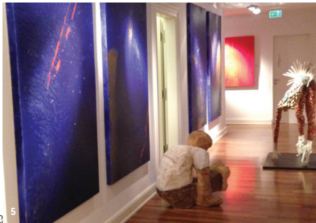
Abb. 5: Der Galeriegang in der Praxis beherbergt wechselnde Ausstellungen.