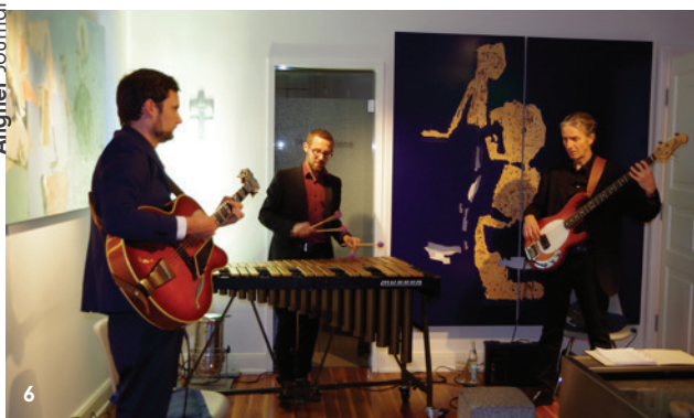
Abb. 6: Bei Kulturevents wird das Wartezimmer auch mal zum Jazzclub.