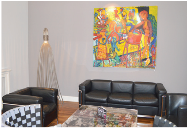
Abb. 4: Im Besprechungsraum herrscht Wohnzimmeratmosphäre.