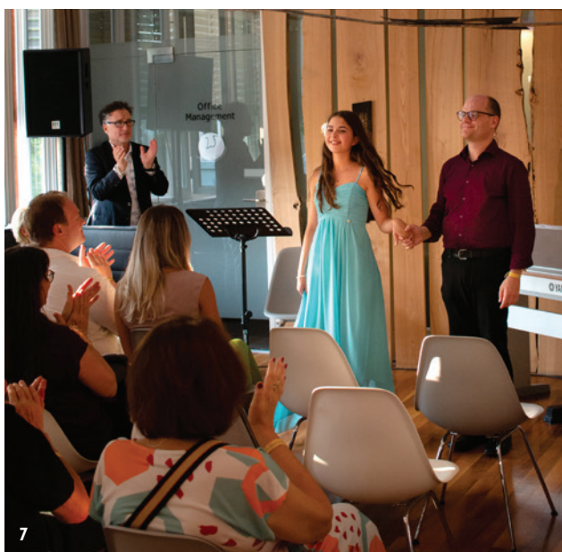
Abb. 7: Eröffnung einer Vernissage mit klassischer Musik und Opernarie.

Künstlerisch planen wir neue Kooperationen, unter anderem mit dem örtlichen Kunstmuseum. Ziel ist es, hybride Ausstellungen zu realisieren, bei denen Werke derselben Künstler an verschiedenen Orten gleichzeitig zu sehen sind. Sie sollten sowohl im Museum als auch in unseren Praxisräumen Anklang finden.