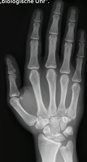
KFO: Handröntgenaufnahme als „biologische Uhr“.