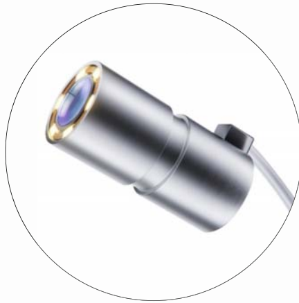
Foto - Video - Licht Eine Revolution in der Diagnostik