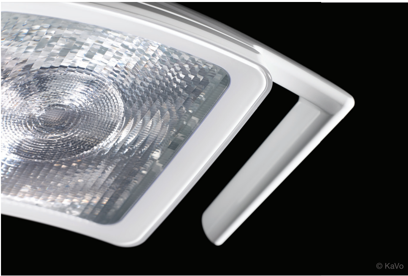
Eine präzise obere Kante sowie eine weich auslaufende Lichtverteilung zu den Seiten und nach unten charakterisieren die Geometrie des großen Leuchtfeldes der KaVo Lumina.

spannung und beruhigende Momente vor und auch zwischen den Behandlungen.