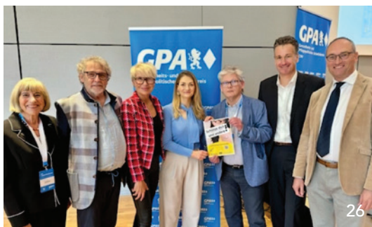
Mit einer Plakation unterstützt die KZVB die bayerische Gesundheitsministerin Judith Gerlach beim Kampf gegen Hepatitis B.