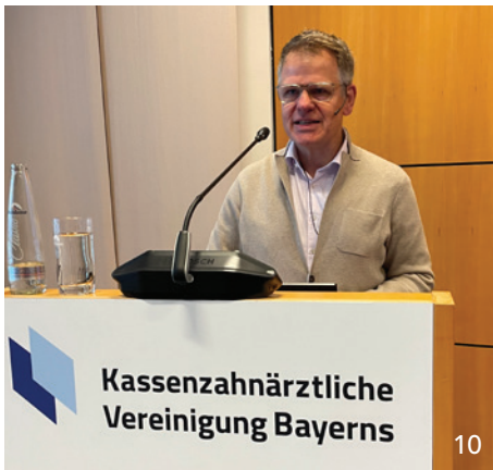
Klare Botschaft vom „Tag der aufsuchenden Betreuung“: Die Zahnärzte lassen ihre Patienten nicht im Stich – auch dann nicht, wenn sie pflegebedürftig werden.