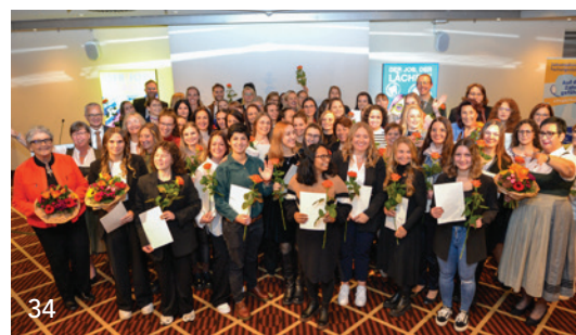
Bereit zum Durchstarten – die besten Absolventinnen und Absolventen der ZFA-Aufstiegsfortbildungen wurden beim 66. Bayerischen Zahnärztetag mit dem Meisterpreis der Bayerischen Staatsregierung ausgezeichnet.