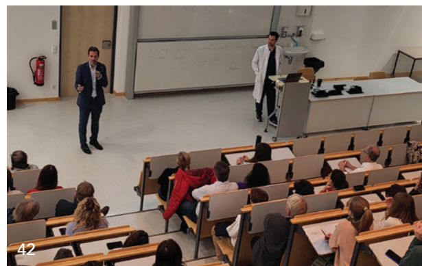
Das Thema „Pulpaerhalt bei tief kariösen Läsionen“ stand im Vordergrund einer Fortbildung in der Zahnklinik der LMU.