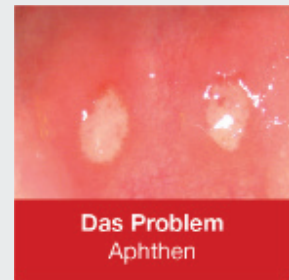
Das Problem Aphthen

lege artis Pharma GmbH + Co. KG www.legeartis.de