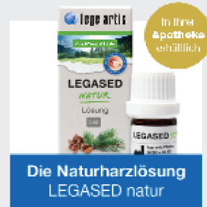
Die Naturharzlösung LEGASED natur

Die Naturharzlösung LEGASED natur unterstützt die Wundheilung sowie Geweberegeneration und trägt zur Schmerzlinderung bei. Die filmbildende Flüssigkeit reduziert das Eindringen von Bakterien und Speiseresten nachhaltig.