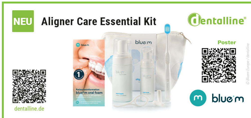
blue®m Aligner Care Essential Kit – das mundgesunde Praxis-Give-away für Aligner-Patienten.

Wer seinen Aligner-Patienten bei Aus-händigung des ersten Schienensatzes gleich die richtige Pflege für die neue Apparatur sowie Zähne und Zahnfleisch in die Hand geben möchte, erhält mit dem blue®m Aligner Care Essential Kit jetzt das perfekte Praxis-Give-away. Das bei dentalline erhältliche, mundgesunde Set enthält alles, was es insbesondere unterwegs für die Reinigung der Aligner und ein rundum frisches Tragegefühl der Korrekturschienen im schulischen, beruflichen oder privaten Alltag braucht. Das Kit beinhaltet den sauerstoffaktiven Reinigungs- und Pflegeschaum blue®m oral foam als 50 ml-Fläschchen für unterwegs und 100 ml-Flasche für zu Hause sowie eine blue®m Day-to-Day Zahnbürste mit weichen Borsten. Im hygienisch praktischen Stofftäschchen finden sich zudem ein Aligner-Häkchen für das leichte Entfernen der Schienen sowie zwei Chewies für den optimalen Sitz der Aligner nach deren Wiedereinsetzen im Mund. Ein beiliegender Patientenflyer informiert darüber hinaus über die optimale Anwendung des Reinigungsschaums.