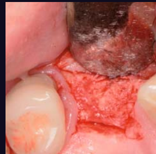
Eigenknochenbildung nach 12 Wochen über das Implantat hinaus