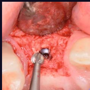
Freilegen des eingewach- senen Implantats mittels Tri Hawk Rosenbohrer