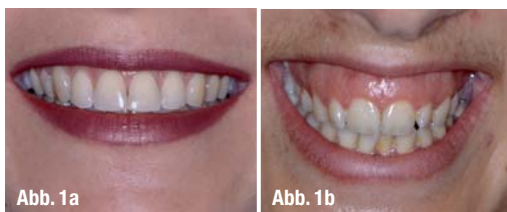
Abb. 1a und b _ a: Attraktives Lächeln, bei dem eine harmonische Beziehung der Oberlippe zum Gingivalrand vorliegt. Die Unterlippe verläuft parallel zur Schneidekante der Oberkieferfrontzähne. b: Lächeln mit „Gummy-Smile“.

Erst der aufgeklärte Patient bringt das Verständnis und die notwendige Motivation vor allem für aufwendige und langwierige Behandlungen auf. Dabei ist die Compliance des Patienten, d.h. seine Kooperationsbereitschaft und seine Belastbarkeit kritisch zu bewerten, da eine festsitzende Multibracketapparatur im Alltagsgeschehen oft als störend empfunden wird.