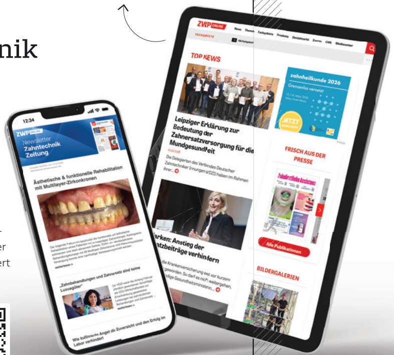
Mock-ups: © Sdecoret Mockup – stock.adobe.com