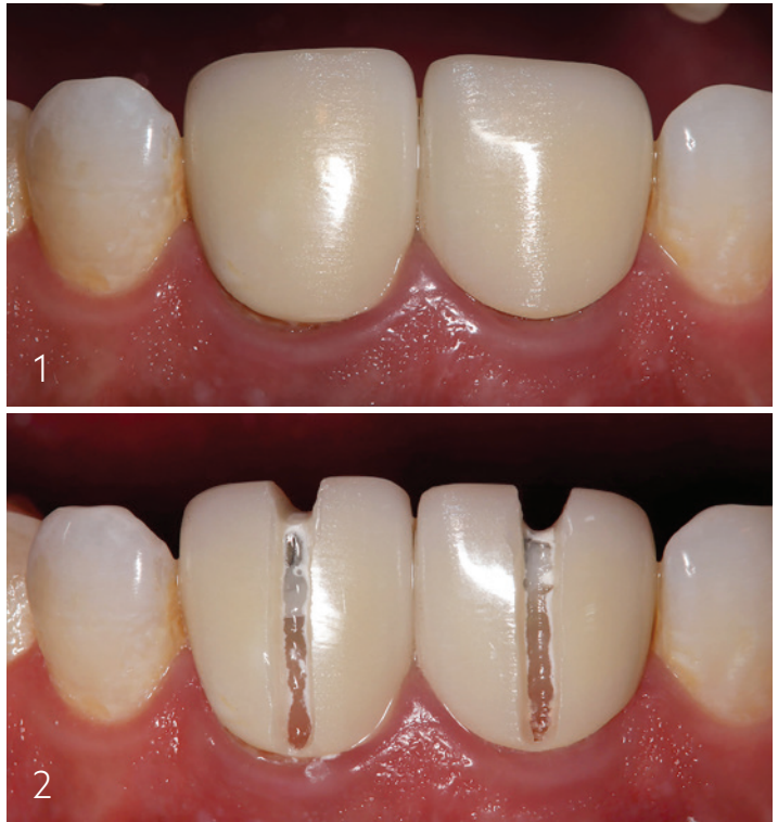
Abb. 1: Ausgangsaufnahme, defekte Zirkonkronen Regio 11 und 21.

Vor der Kronenentfernung sind neben der Prüfung auf Karies, Randspaltbildung und Pulpabeteiligung auch die vorliegenden Stümpfe und gegebenenfalls vorhandene Stifte zu beurteilen. Die radiologische Diagnostik dient dazu, die Länge und Position von Wurzelstiften sowie mögliche apikale Pathologien auszuschließen und die Entfernungstechnik zu planen. Eine adäquate marginale Aufbereitung und die Beurteilung des Zementtyps (z. B. Adhäsiv vs. Ionomer) sind präoperativ essenziell, da sie die mechanische Retention und die Schwierigkeit der Kronenentfernung beeinflussen.