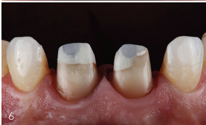
Abb. 4: Zustand nach EKR. – Abb. 5: Präparation der Zähne 11 und 21 von inzisal. – Abb. 6: Präparation der Zähne 11 und 21 von vestibulär.