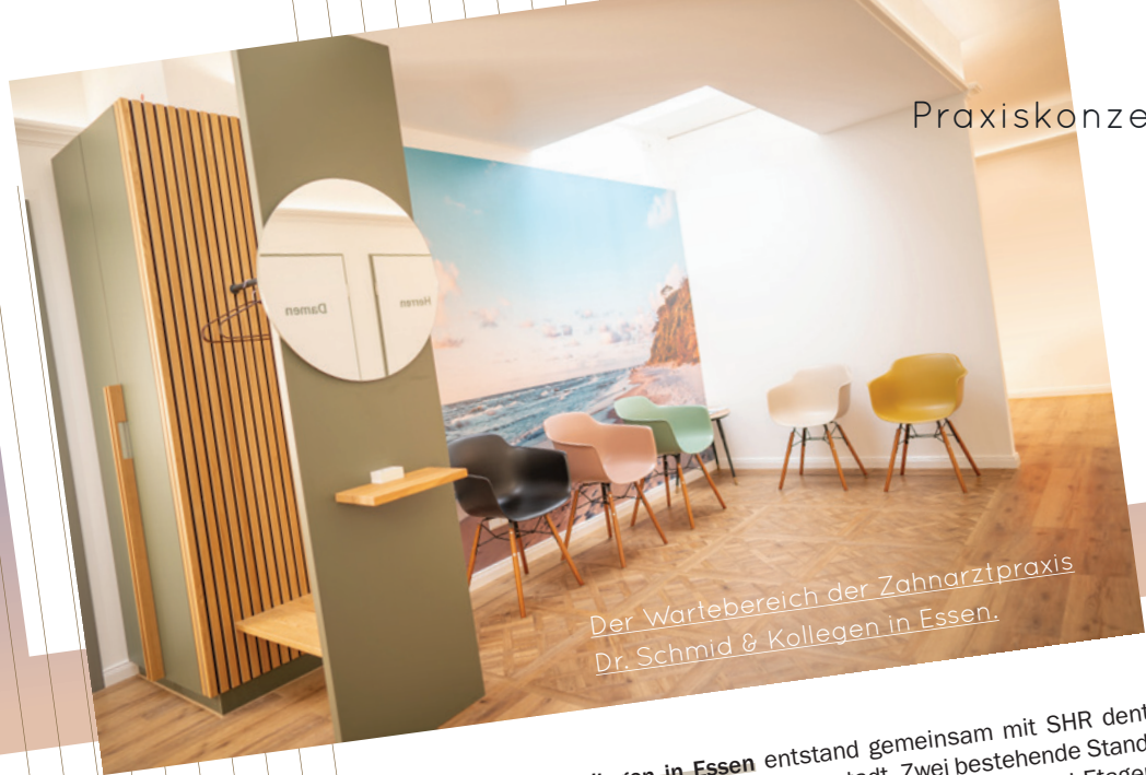
Der Wartebereich der Zahnarztpraxis Dr. Schmid & Kollegen in Essen.

„Die Betreuung war persönlich, engagiert und auf Augenhöhe.“