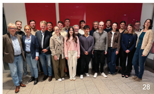
Der Empfang der KZVB für die Absolventen des Studiengangs Zahnmedizin im Zahnärzthehaus München hat Tradition und zeigt, wie die Stimmung beim Nachwuchs aktuell ist. Fünf Absolventen erzählen, wie sie sich ihre berufliche Zukunft vorstellen.