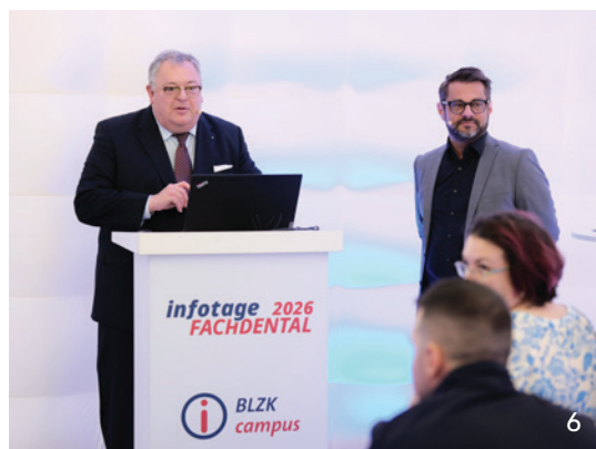
Auf den infotagen FACHDENTAL am 13. und 14. März in München präsentierte die Bayerische Landeszahnärztekammer mit dem „BLZK campus“ ein kompaktes Fortbildungsprogramm für Zahnärztinnen und Zahnärzte.