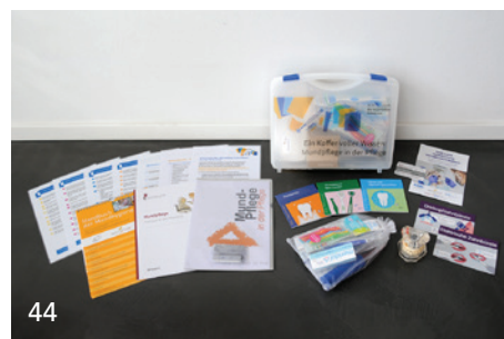
„Ein Koffer voller Wissen: Mundpflege in der Pflege“ – der Schulkoffer der BLZK ist eine der Maßnahmen, um Zahnärztinnen und Zahnärzte dabei zu unterstützen, Pflegenden das notwendige Wissen zur Mundpflege zu vermitteln.