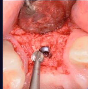
Freilegen des eingewachsenen Implantats mittels Tri Hawk Rosenbohrer