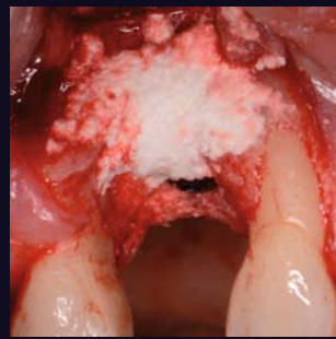
Auffüllen des Defektes mit EthOss Knochenregeneration