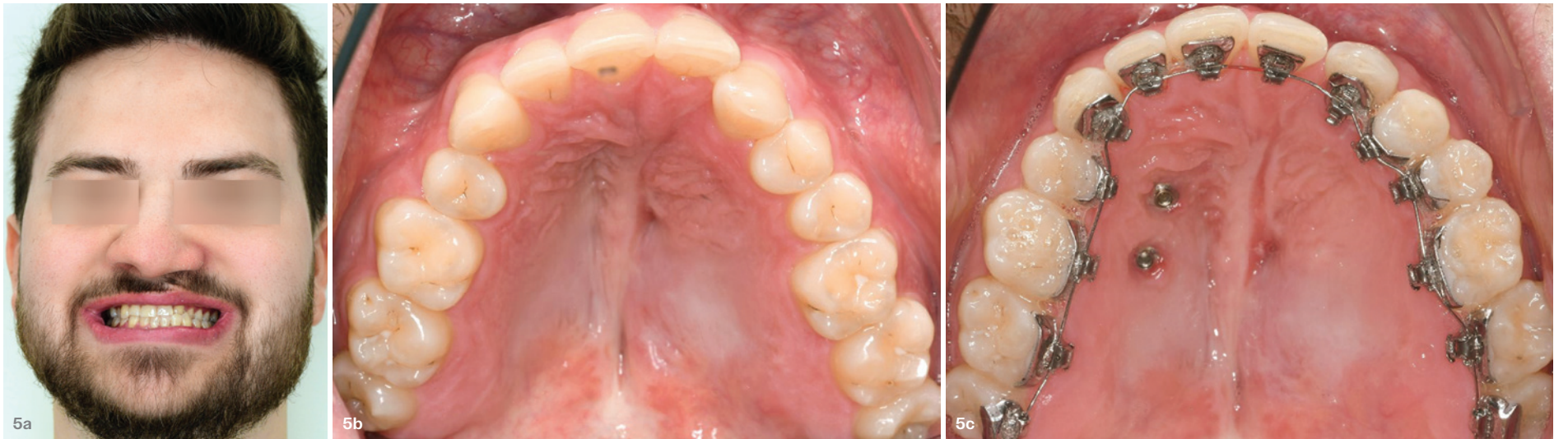
Abb. 5a-c: Vollständig individualisierte linguale Apparatur bei einem erwachsenen Patienten mit linksseitiger Lippen-Kiefer-Gaumen-Spalte. – Abb. 6a-d: Die Lingualtechnik kann mit einer skelettalen Verankerungsapparatur zur aktiven Einordnung der verlagerten Zähne 13 und 23 bei einer erwachsenen Patientin mit Treacher-Collins-Syndrom kombiniert werden.

sorgfältige Indikationsstellung sowie interdisziplinäre Behandlungsplanung. Gaumenspannung, Narbengewebe sowie Defizite des Hart- und Weichgewebes können die Stabilität beeinträchtigen und machen die Behandlung im Vergleich zu Patienten ohne Spalte komplexer. 24 Da die orofazialen Funktionen bei LKG-Patienten häufig stark kompromittiert sind, könnten ein weiterer chirurgischer Eingriff und das damit verbundene narbig veränderte Gewebe, die reduzierte Vaskularisation und die eingeschränkte Gewebeelastizität diese eventuell zunehmend negativ beeinflussen. Eine begleitende logopädische Therapie, aber auch die richtige Wahl der geeigneten Behandlungsapparatur können bei dieser Patientengruppe funktionell förderlich sein. Paramediane Gaumenpins in Kombination mit patientenindividuellen Suprakonstruktionen bieten darüber hinaus vielfältige Einsatzmöglichkeiten. Ein skelettal verankerter Cantilever ermöglicht nach chirurgischer Freilegung eine nebenwirkungsarme aktive Einordnung verlagelter und retinierter Zähne. Dies ist beispielsweise häufig bei Patienten mit LKG erforderlich, bei denen multiple, spaltnahe Retentionen bzw. ausgeprägte Verlagerungen zur Herausforderung werden können. 25,26 Mithilfe der Lingualapparatur und präziser, maximaler Torquekontrolle können die geborgenen Zähne im nächsten Schritt körperlich aufgerichtet und bewegt sowie