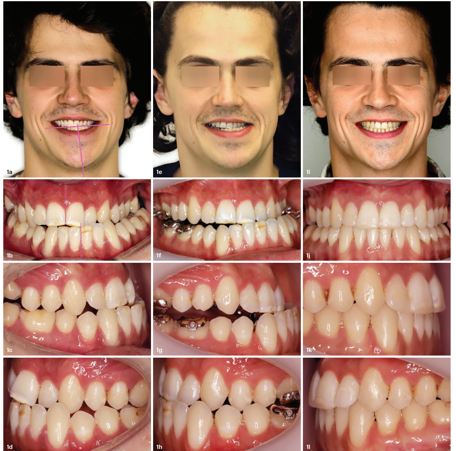
Abb. 1a–l: Anfangsbefund eines erwachsenen Patienten mit skelettaler sagittaler, vertikaler und transversaler Diskrepanz. Dental zeigt sich eine asymmetrische Klasse III-Okklusion mit einem lateralen und frontalen Kreuzbiss (a–d). Nach prächirurgischer kieferorthopädischer Dekompensation (e–h). Abschlussbefund nach bimaxillärer Umstellungsosteotomie mit einer stabilen und funktionellen Interdigitation (i–l).

Die vollständig individualisierte linguale Apparatur (VILA) hat sich als qualitätsorientierte und effiziente Behandlungsmethode in der modernen Kieferorthopädie etabliert. Die Lingualtechnik weist ein umfassendes Indikationsspektrum auf und kann unabhängig von der Komplexität der zugrunde liegenden Fälle eingesetzt werden. Sie eignet sich u.a. für kieferorthopädisch-kieferchirurgische Therapien, für Grenzfälle ohne chirurgische Intervention sowie für komplexe angeborene Fehlbildungen. Bei erhöhten Planungsanforderungen oder mangelnder Patientencompliance kann die VILA patientenspezifisch um skelettale Verankerungselemente erweitert werden.