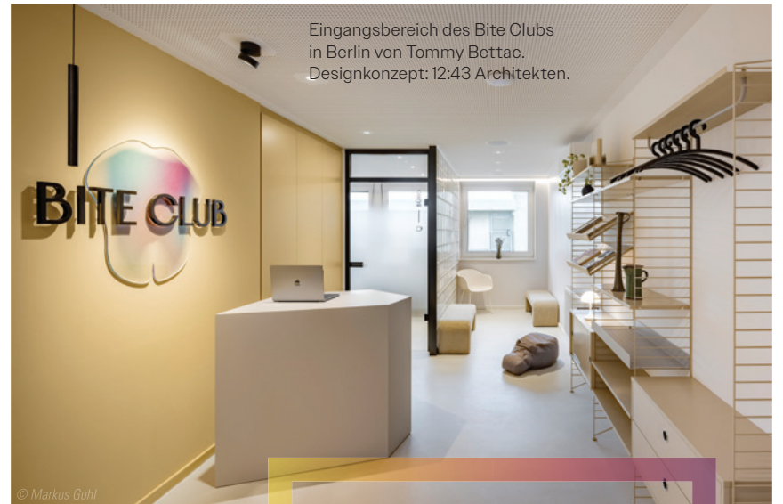
Eingangsbereich des Bite Clubs in Berlin von Tommy Bettac. Designkonzept: 12:43 Architekten.

Für das Interview mit Tommy Bettac in voller Länge hier entlang.