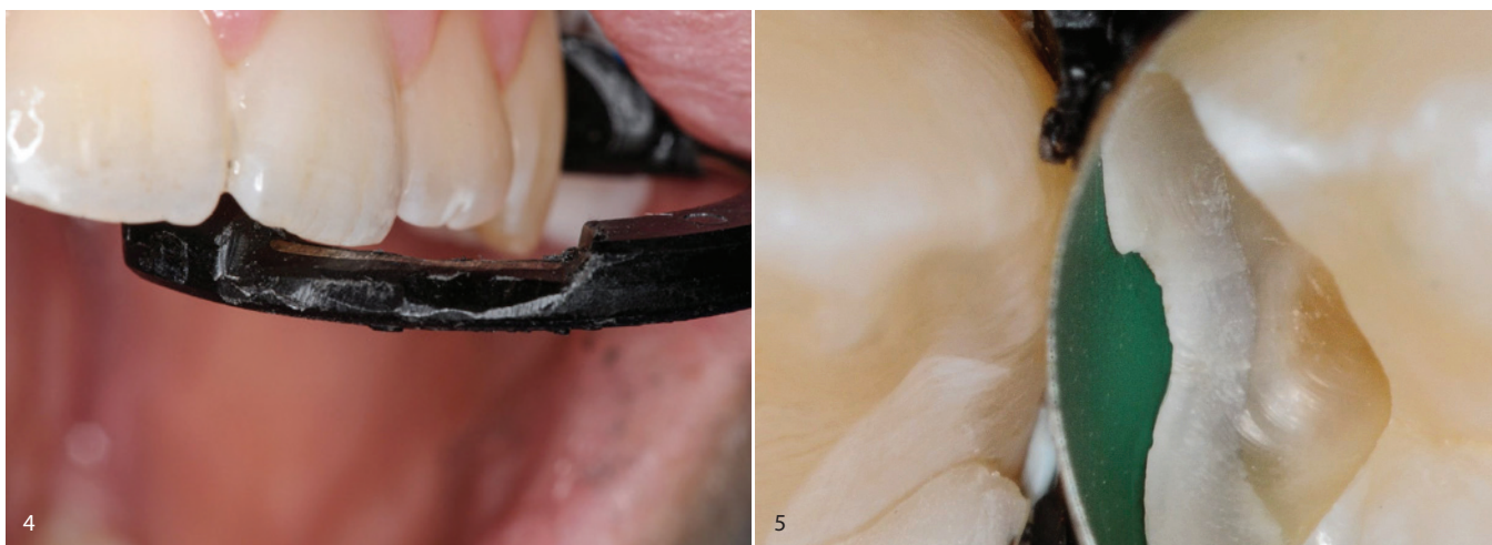
Abb. 4: Intraoperative Situation mit Matrize und Ring – Kontrolle Kastenboden. – Abb. 5: Okklusale Ansicht nach Fertigstellung und Politur.

posit ein günstiges Verhältnis aus ästhetischer Suffizienz und Workflow-Vereinfachung bieten kann. Entscheidend waren eine kontrollierte Schichtstärke, stabile Polymerisation, sowie ein präzises Finishing/Polishing zur Optimierung der optischen Einbindung (Gloss, Oberflächenstreuung).