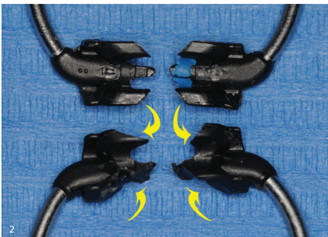
Abb. 2: Entfernte Restauration/Materialfraktur (Dokumentation). – Abb. 3: Separation und Matrizenmanagement zur Approximalpräparation.

Begründung der Materialwahl: Die Restauration betraf überwiegend Bereiche mit begrenzter Sichtbarkeit vestibulärer Kanten, wodurch ein Smart-Shade-Kom-