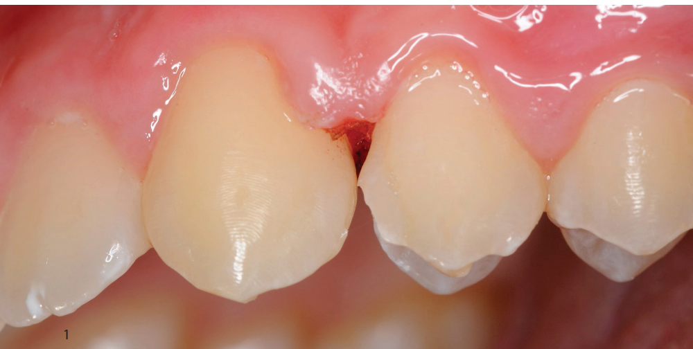
Abb. 1: Präoperative Situation mit frakturierter Restauration an Zahn 24mo.

Zur besseren Darstellung des approximalen Kastenbodens wurden Keil und Teilmatrizenring zur Separation der Zähne 23/24 eingesetzt. Anschließend erfolgte die Positionierung eines anatomischen