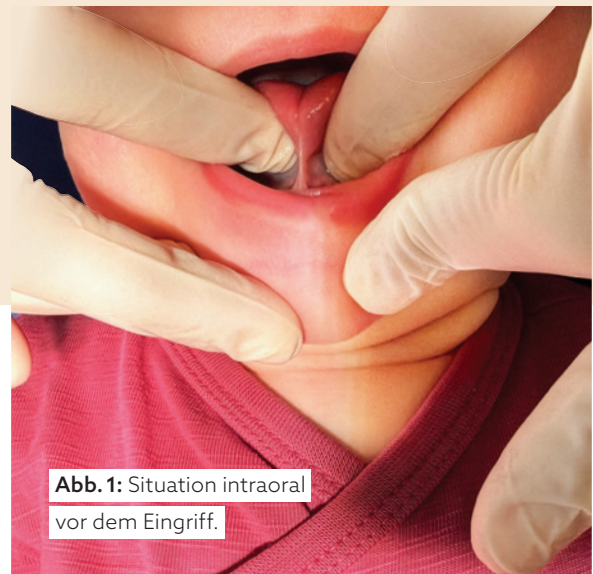
Abb. 1: Situation intraoral vor dem Eingriff.

Stillen gilt als empfohlene Ernährungsform im Säuglingsalter und spielt eine zentrale Rolle für die Gesundheit von Kind und Mutter. Dennoch treten insbesondere in den ersten Lebenswochen häufig Schwierigkeiten beim Stillen auf, die für die betroffenen Familien wie für die betreuenden Fachpersonen eine Herausforderung darstellen. In diesem Kontext rückt die Ankyloglossie zunehmend in den Fokus klinischer Diskussionen, da sie als möglicher Einflussfaktor auf die orale Funktion und den Stillserfolg betrachtet wird.