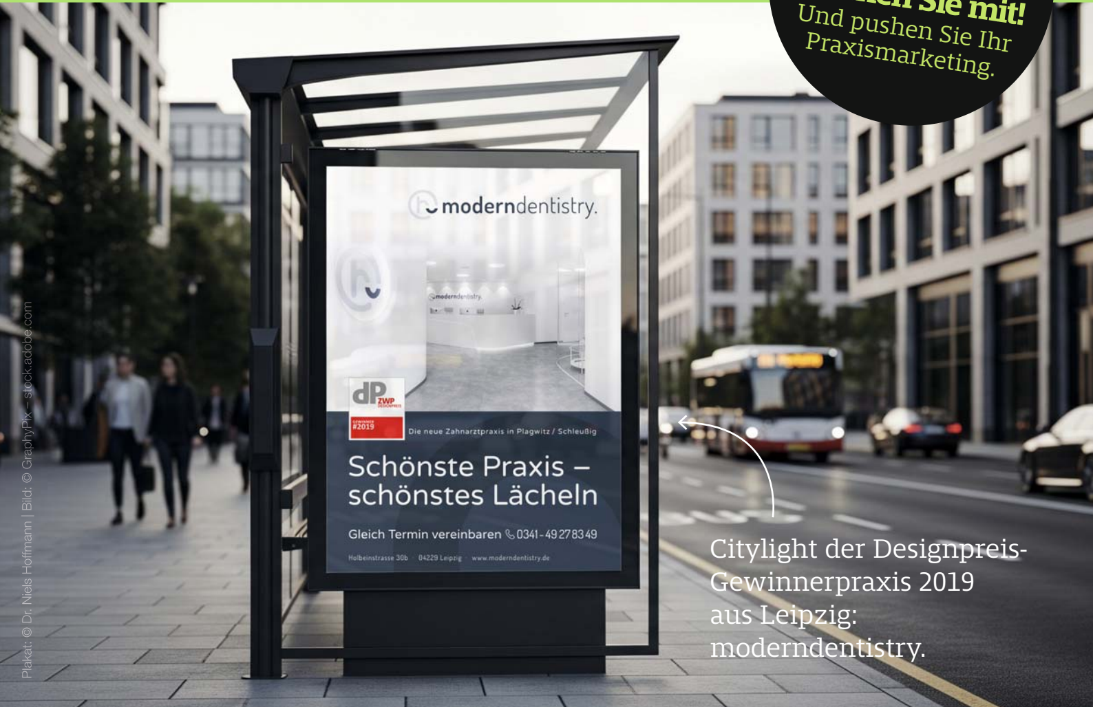
Citylight der Designpreis- Gewinnerpraxis 2019 aus Leipzig: moderndentistry.

Machen Sie mit! Und pushen Sie Ihr Praxismarketing.