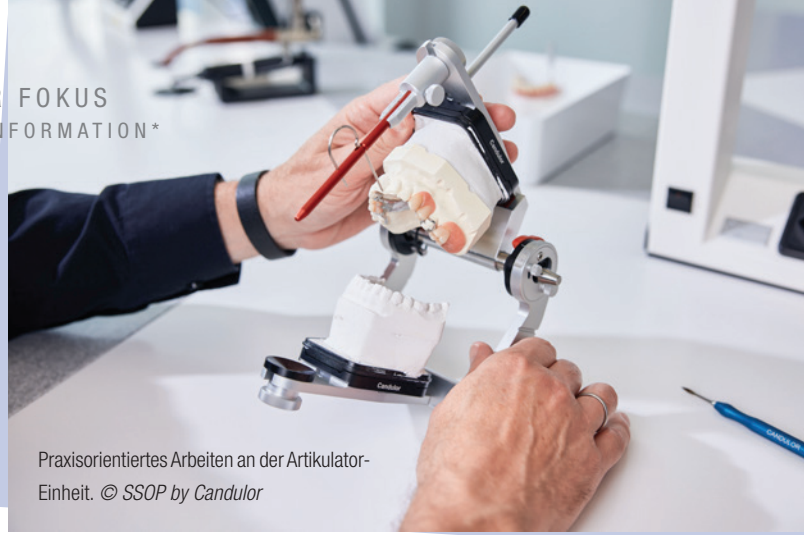
Praxisorientiertes Arbeiten an der Artikulator-Einheit.