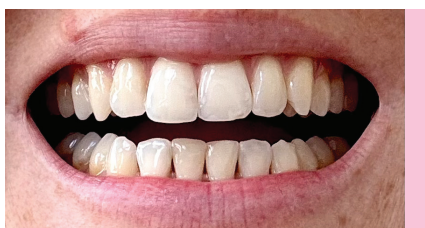
Abb. 4: Vier Tage nach Bleaching.

Auch aus Patientensicht überzeugt das Set: Die Anwendung ist angenehm und bereits nach zwei Bleichgel-Zyklen à zehn Minuten zeigte sich eine natürliche, sichtbare Aufhellung – ohne Sensibilitäten. Ein rundum gelungenes Ergebnis, das das Lächeln auf schonende Weise auffrischt (Abb. 4). <<<