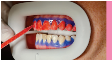
Abb. 2: Bleichgel MANIShine Active White.

Das Bleichgel MANIShine Active White (Abb. 2) punktet mit hoher Standfestigkeit und einem starken farblichen Kontrast, was die Sichtbarkeit und Kontrolle für den Behandler erhöht. Die Aufhellungswirkung ist deutlich sichtbar – auch für Laien –, was zu einer hohen Patientenzufriedenheit und einer stärkeren Praxisbindung führt.