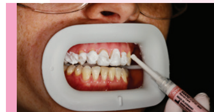
Abb. 3: Remin Care Gel.

Zur Nachsorge dient das Remin Care Gel (Abb. 3), das empfindliche Zähne beruhigt und gezielt Reizungen entgegenwirkt. Die einfache Anwendung und gute Haftung machen es zu einer gelungenen Abrundung des Systems. Der Einsatz eines Lippen- und Zungenhalters erleichtert zudem die Handhabung für das Praxisteam.