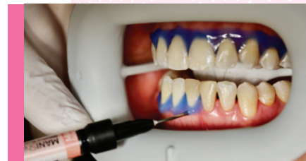
Abb. 1: MANIShine Gingiva Guard.

In der Praxis überzeugt das System durch seine durchdachte Struktur: Der MANIShine Gingiva Guard (Abb. 1) lässt sich zügig und zuverlässig applizieren. Seine viskose Konsistenz ermöglicht ein schrittweises, präzises Auftragen und eine sichere Verbindung einzelner Abschnitte – beim Entfernen bleibt er als ein Stück erhalten. Eine gründliche Trocknung der Zähne unterstützt die sichere Anwendung zusätzlich.