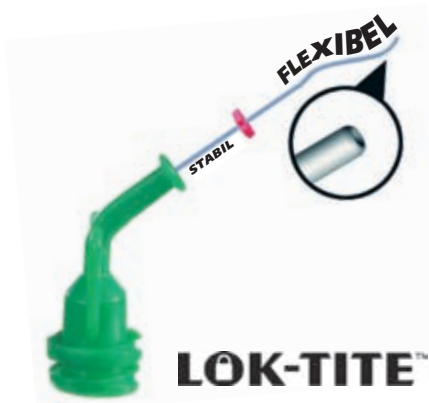
Mit Beflockung zur Reinigung der Kanalwände NaviTips FX / Ø 0,30 mm