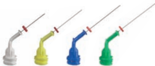
Für die Applikation von Gelen und Flüssigkeiten NaviTips 30 ga / Ø 0,30 mm