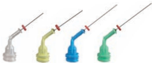
Für die Applikation von Pasten NaviTips 29 ga / Ø 0,33 mm