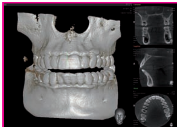
>> FOV 8.5 x 8.5cm deckt die überwiegenden Indikationen der allgemeinen Zahnheilkunde ab.

Das Spitzen DVT/OPG für die innovative Praxis.