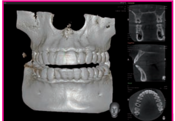
>> FOV 8.5 x 8.5cm deckt die überwiegenden Indikationen der allgemeinen Zahnheilkunde ab.

Das Spitzen DVT/OPG für die innovative Praxis.