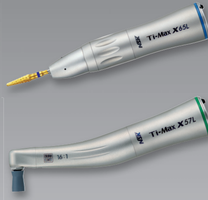
X57L 16:1 Untersetzung