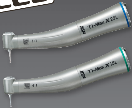
X25L 1:1 Übertragung