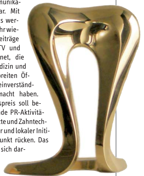
Der proDente Journalistenpreis Abdruck wird auf der IDS verliehen.

Höhepunkte in der Messewoche stellen wie schon in den letzten Jahren die Verleihung des proDente Journalistenpreises 2011 und des Kommunikationspreises 2011 dar. Mit dem Journalistenpreis werden auch in diesem Jahr wieder herausragende Beiträge aus Print, Online, TV und Hörfunk ausgezeichnet, die die Themen Zahnmedizin und Zahntechnik einer breiten Öffentlichkeit allgemeinverständlich zugänglich gemacht haben. Der Kommunikationspreis soll besonders herausragende PR-Aktivitäten einzelner Zahnärzte und Zahntechniker sowie regionaler und lokaler Initiativen in den Blickpunkt rücken. Das proDente-Team freut sich darauf, die Messebesucher am Stand zu begrüßen und steht für Fragen und Gespräche zur Verfügung.