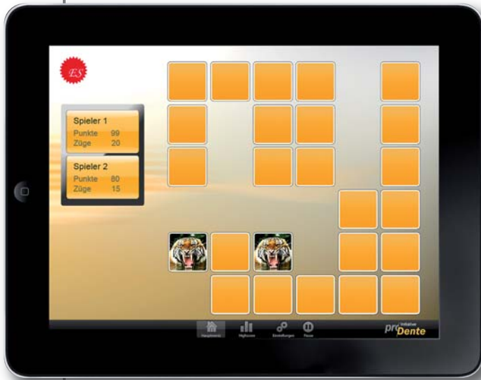
Das proDente Memory-Spiel auf dem iPad.