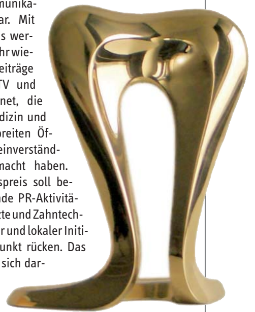
Der proDente Journalistenpreis Abdruck wird auf der IDS verliehen.

Höhepunkte in der Messewoche stellen wie schon in den letzten Jahren die Verleihung des proDente Journalistenpreises 2011 und des Kommunikationspreises 2011 dar. Mit dem Journalistenpreis werden auch in diesem Jahr wieder herausragende Beiträge aus Print, Online, TV und Hörfunk ausgezeichnet, die die Themen Zahnmedizin und Zahntechnik einer breiten Öffentlichkeit allgemeinverständlich zugänglich gemacht haben. Der Kommunikationspreis soll besonders herausragende PR-Aktivitäten einzelner Zahnärzte und Zahntechniker sowie regionaler und lokaler Initiativen in den Blickpunkt rücken. Das proDente-Team freut sich darauf, die Messebesucher am Stand zu begrüßen und steht für Fragen und Gespräche zur Verfügung.