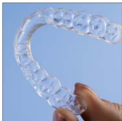
Aufbisschutz im Normalzustand