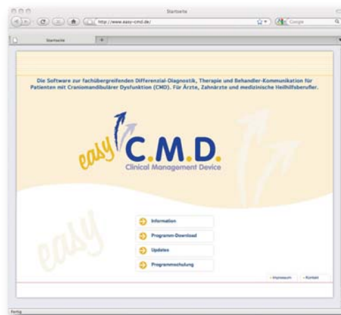
Abb. 3: Service und Informationen zum Programmsupport findet man unter www.easy-cmd.de

Mit diesen Worten kann man unsere Erfahrungen zusammenfassen. Unser