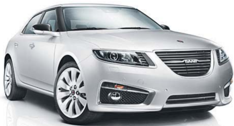
Abb. zeigt Sonderausstattung.