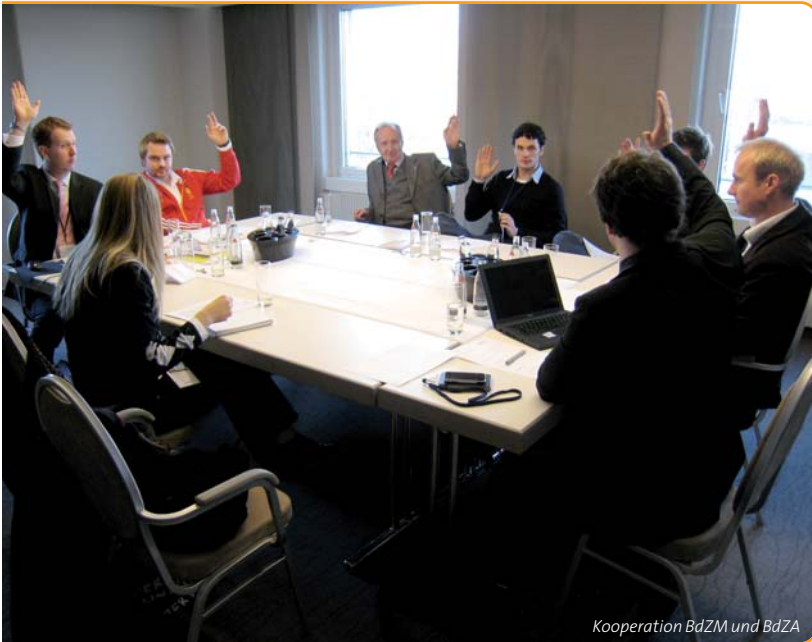
Kooperation BdZM und BdZA