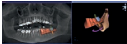
Planung. Erstmals Fusionierung von optischen Abdrücken und virtueller Prothetik mit 3D Röntgendaten