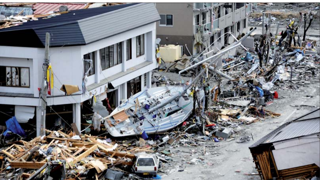
• Trümmer im Fischereihafen von Ofunato, 15. März 2011. • Debris covers the fishing port of Ofunato, Japan, March 15, 2011.

Zwei Prozent der IDS-Umsätze sollen direkt an „Aktionsbündnis Katastrophenhilfe“ gehen German dental manufacturer donates two per cent of its revenue at IDS to relief network